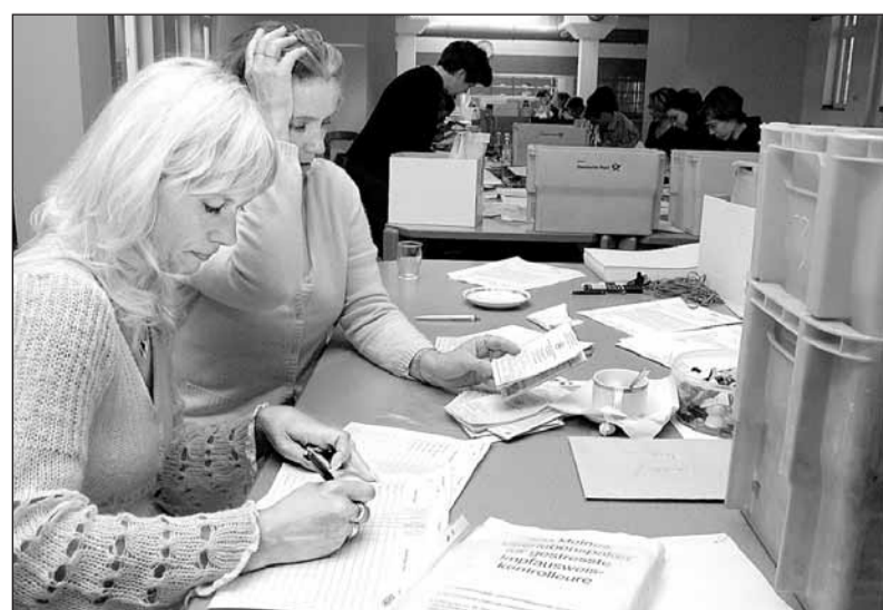
Im Kreis Mettmann wurden bis Freitag fast 80 Prozent aller Impfbücher der Schüler kontrolliert. Die Überprüfung dauert an.