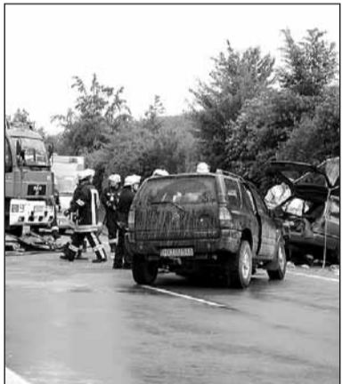
Die Fahrerin konnte nur tot aus dem Wrack ihres Autos geborgen werden.

Höxter (WB/rob). Eine Frau ist Freitag bei einem Verkehrsunfall auf der B 239 am Kloster Marienmünster ums Leben gekommen. Um 13.35 Uhr war ein Opel-Fahrer auf die Gegenfahrspur geraten. Er rammte einen Buli und dann den Pkw der Frau mittleren Alters. Sie wurde im Wagen eingeklemmt. Die Ärzte konnten die Autofahrerin, die einen Wagen mit Lipper Kennzeichen fuhr, nicht retten. Sie starb noch am Unfallort.